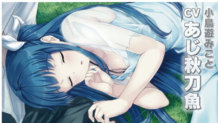
小鳥遊みこと CV あじ秋刀魚