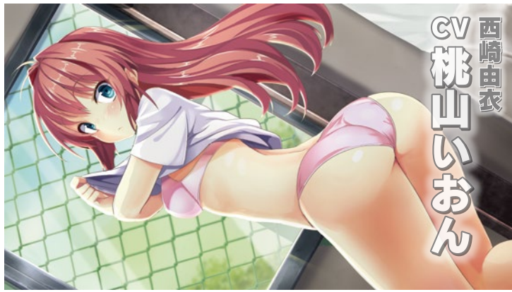
西崎由衣 CV 桃山いおん