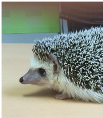
●ハリネズミの針山部長。まんまるおめが愛らしい。