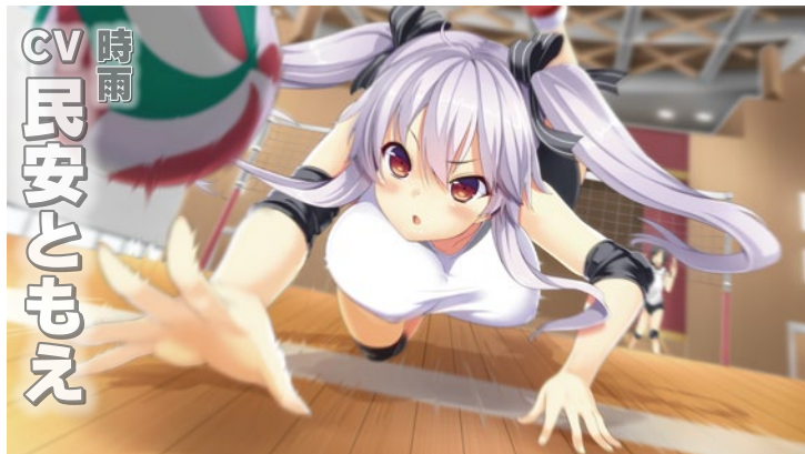
時雨 CV 民安とまえ