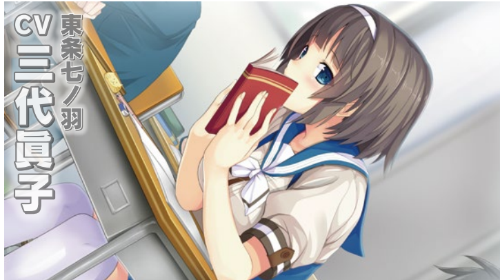
東条七ノ羽 CV 二代真子