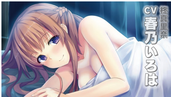
桜真里奈 CV 春乃いろは